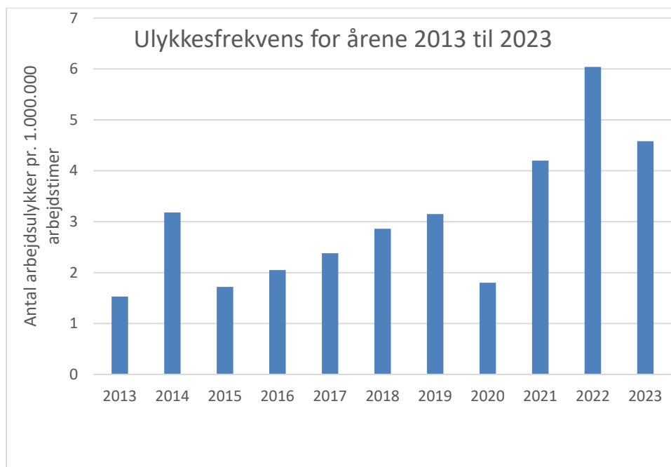
Figur 1, antal registrerede arbejdsulykker pr. million arbejdstimer