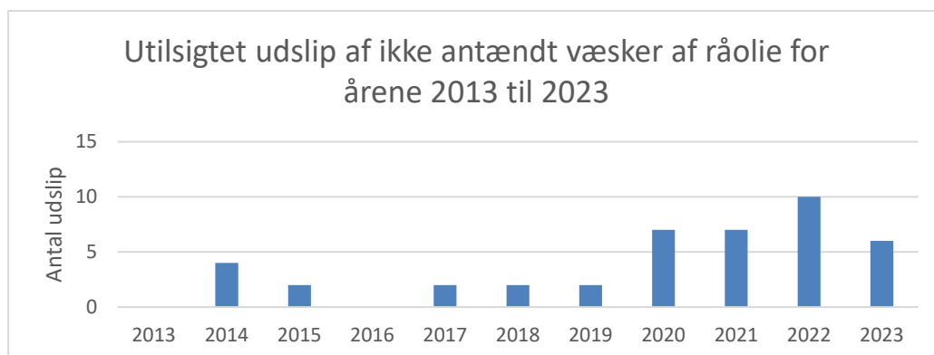
Figur 3, antal utilsigtede udslip af væsker af råolie, hvis udledte masse er større end eller lig med 60 kg. Væsker af råolie omfatter i denne sammenhæng alle olieprodukter, også hydraulikolier og smørelolier.

Der er i 2023 registreret 6 utilsigtede udslip af ikke antændte væsker af råolie og andre olieprodukter, hvor den udledte masse er større end, eller lig med 60 kg. Søjlediagram for utilsigtede udslip af ikke antændt væsker af råolie, hvis udledte masse er større end, eller lig med 60 kg for årene 2013 til 2023, fremgår af figur 3.