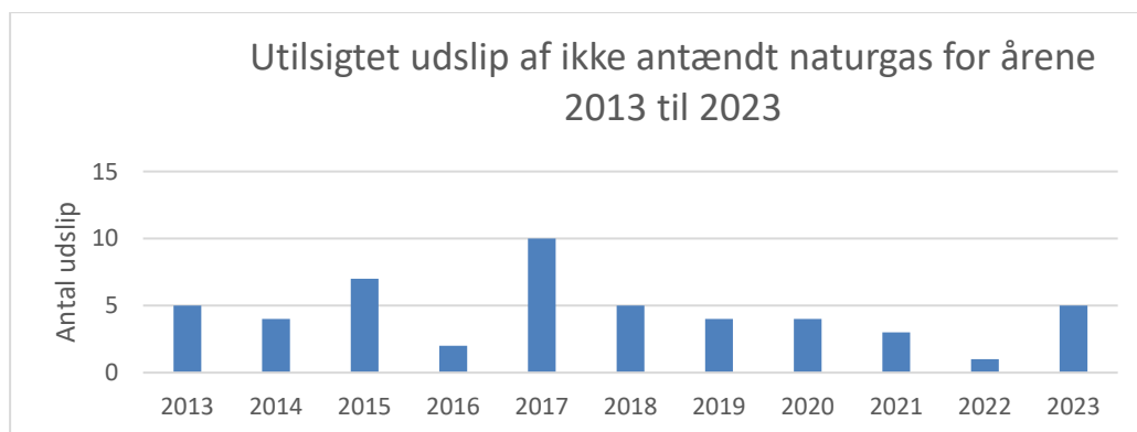
Figur 2, antal utilsigtede udslip af gas, hvis udledte masse er større end eller lig med 1 kg