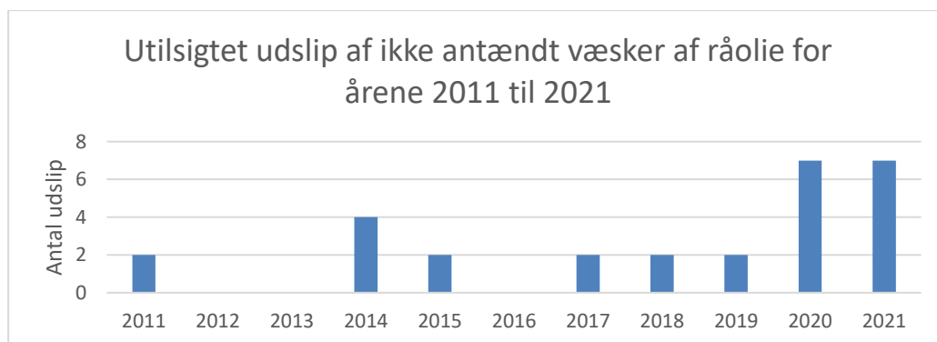
Figur 3, antal utilsigtede udslip af væsker af råolie, hvis udledte masse er større end eller lig med 60 kg. Væsker af råolie omfatter i denne sammenhæng alle olieprodukter, også hydraulikolier og smøreolier.

Søjlediagram for utilsigtede udslip af ikke antændt væsker af råolie, hvis udledte masse er større end eller lig med 60 kg for årene 2011 til 2021, fremgår af figur 3.