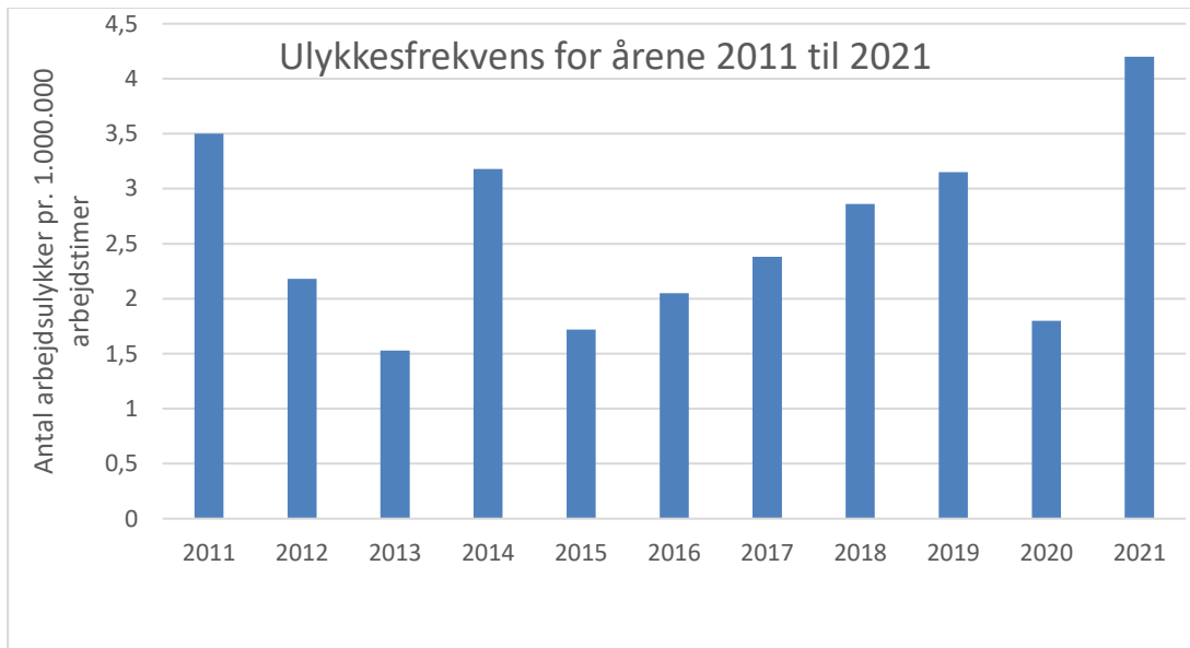
Figur 1, antal registrerede arbejdsulykker pr. en. million arbejdstimer