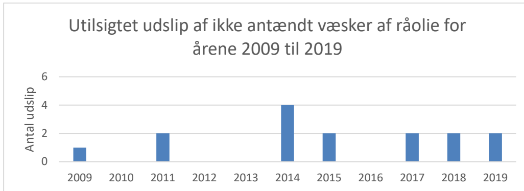
Figur 3, antal utilsigtede udslip af væsker af råolie, hvis udledte masse er større end eller lig med 60 kg